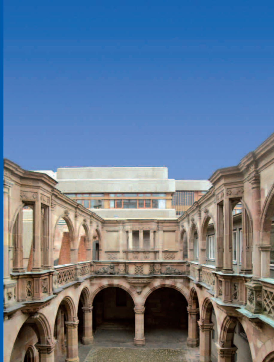
Hinter dem Fragment des Hofes, der bis 1959 zum Teil wiederaufgebaut wurde, ragt die Betonfassade des angrenzenden Schulhauses auf.