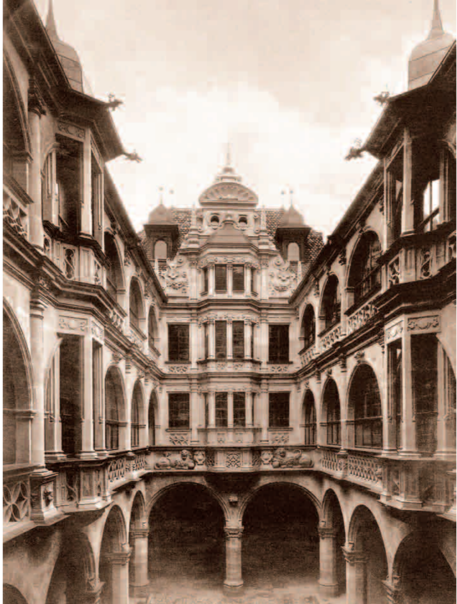
Das alte Bild weist in die Zukunft. Der Pellerhof mit seinen Arkaden, Maßwerkbrüstungen, antiken Säulenordnungen und dem prächtigen Giebel. Ein Kleinod, das auf seine Wiedergeburt wartet.